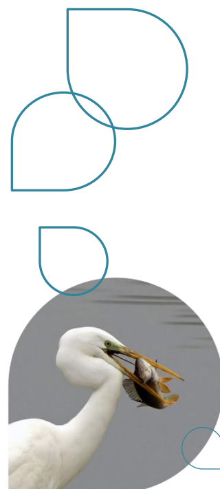
Grande Aigrette