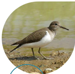
Chevalier guignette